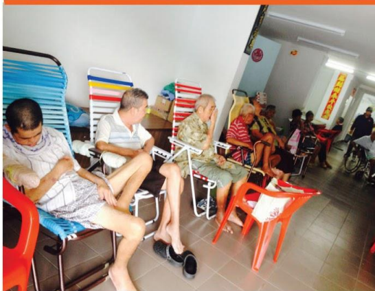
7 得胜之家总部 (Rumah Victory Head Office) 2, Jalan 8, Taman Bukit Kuchai, Batu 8, Jalan Puchong, 47100, Selangor, Malaysia Office : 603-807 51660